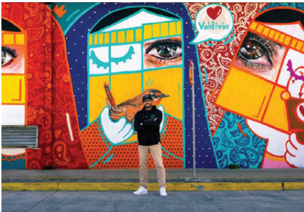
An initiative with an established global presence across Asia, Europe, Africa & the Americas

Diseñado para construir alianzas duraderas mediante intercambios culturales, educativos, creativos, económicos y comunitarios