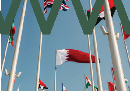
Qatar's flagship cultural diplomacy programme

El programa representativo de la diplomacia cultural de Qatar