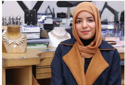
Legacy-focused, people-centred, and innovation-driven

Una iniciativa con presencia global consolidada en Asia, Europa, África y las Américas