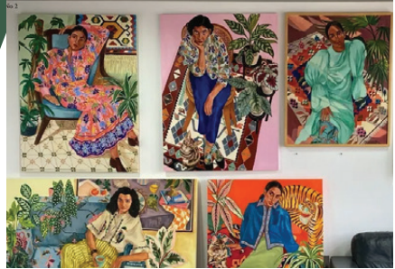
Designed to build lasting partnerships through cultural, educational, creative, economic and community exchange

El programa representativo de la diplomacia cultural de Qatar